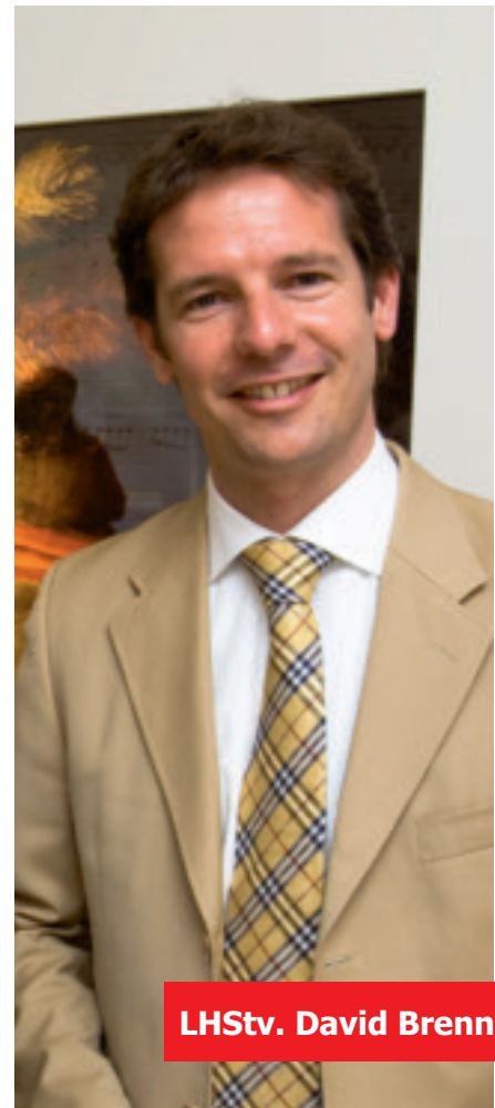
LHStv. David Brenner

um zwei Prozent an. Eine Nulllohnrunde für die öffentlich Bediensteten - wie derzeit von der Politik gefordert - würde in diesem Fall erneut eine Minderung der Einkommen im öffentlichen Dienst bedeuten. Man kann nur hoffen, dass die Bundesregierung zu einer intelligenteren Lösung ihrer Finanzprobleme als einer Nulllohnrunde kommt. Für die Gehaltserhöhungen 2011 und 2012 hat sich in Salzburg die Landesregierung insofern festgelegt, dass diese für beide Jahre ab Jänner 2012 gewährt werden.